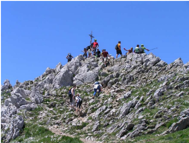
Subimos a la Cruz, todos alcanzamos la cima.