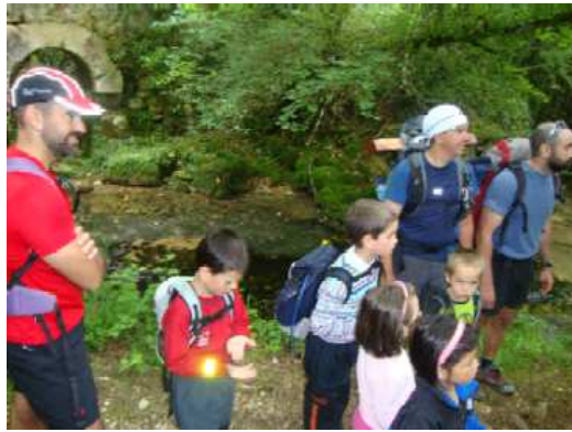
Molino de Igoroin

En Roitegui los niños y no tan niños jugaron el los columpios tanto a la ida como a la vuelta.