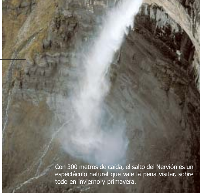
Con 300 metros de caída, el salto del Nervión es un espectáculo natural que vale la pena visitar, sobre todo en invierno y primavera.